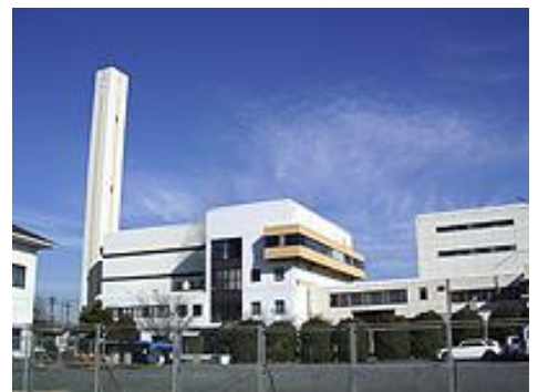
八甫清掃センター