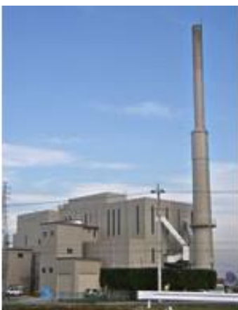
久喜宮代清掃センター