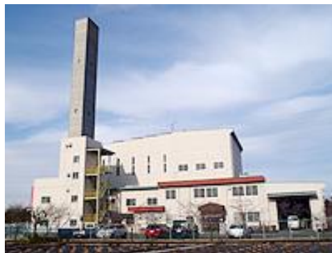
菖蒲清掃センター