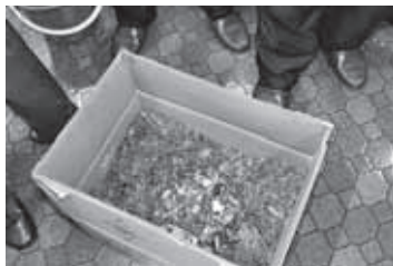
材料を入れたダンボールに生ごみを投入

2時間ほど行われ、その後、実習では、みかん箱やりんご箱のダンボールや土のう袋（ホームセンターなどで購入可能）を使用してたい肥を作成しました。ダンボールを使用する場合は、ダンボールを組み立てるところから行い、腐葉土、もみがらくん炭、米ぬか、生ごみを材料としたものとピートモス、もみがらくん炭、米ぬか、生ごみを材料としたものの2種類の材料でたい肥を作成しました。また、土のう袋を使用した場合は、米ぬか、土、落ち葉、水、生ごみを材料としたものと