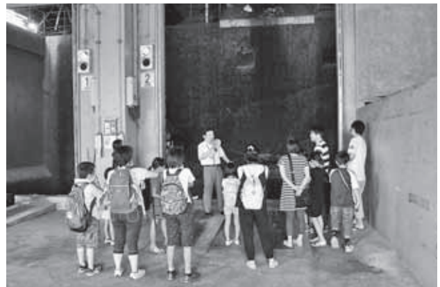
昨年度の3Rでゴミを減らそう講座の様子